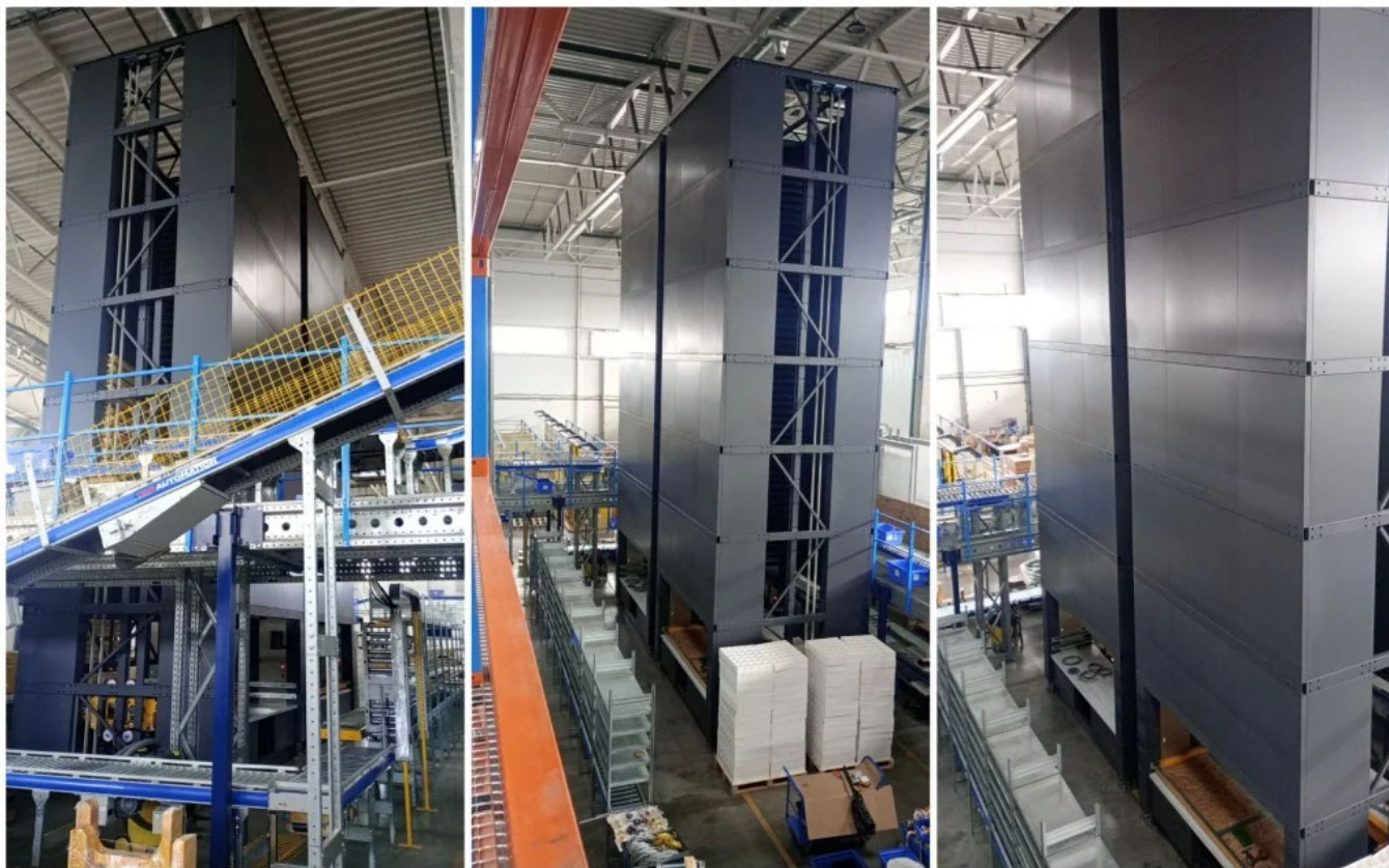
Система LogiMat на складі «Жуляни».

Окрема особливість терміналу — рівень автоматизації. На складі працюють сучасні конвеєрні лінії та автоматизовані системи зберігання LogiMat. Саме в «Жулянах» встановлено найбільші логімат в Україні: кожен має висоту 11 метрів, 100 полиць і здатний зберігати понад 15 тисяч найменувань. Їхня конструкція дозволяє розділити процеси поповнення та відбору товару, а автоматична подача полиць значно скорочує час комплектування замовлень.