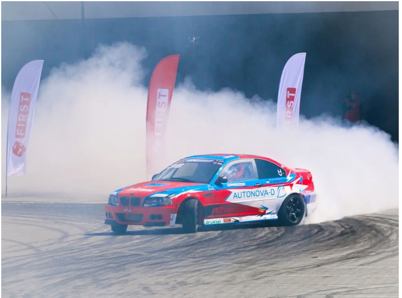
Дрифтовий автомобіль Євгена Дубіни