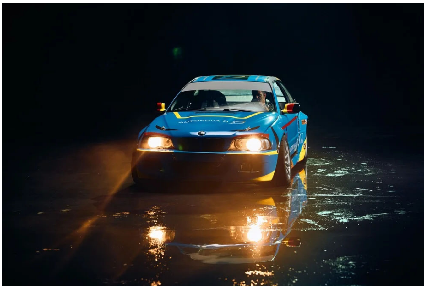
Дрифтовий шоу-кар АвтоНова-Д

Окремий напрям проєкту — власний автомобіль АвтоНова-Д. Це фановий шоу-кар, створений для виставок, навчальних заходів і внутрішніх активностей компанії. Зокрема, АвтоНова-Д планує проводити Drift Day — виїзні події для співробітників із можливістю побачити автомобіль зблизька, поспілкуватися з пілотами, відпочити й відчути атмосферу автоспорту наживо.