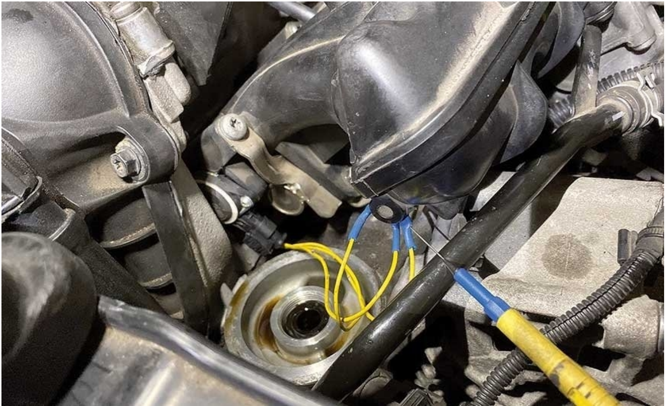
Фото 1. Щоб зняти датчик положення заслінок G336 і отримати доступ до його штекера у двигуні 1.8 TFSI потрібно відкрутити оливний фільтр

У другій частині статті про поширені несправності і типові поломки двигунів 1.8/2.0 TFSI сімейства EA888, ми більш детально зупинимося на конкретних діагностичних проблемах. При ремонті двигунів цього типу важливо дотримуватися вказівок, що містяться в сервісній літературі виробника, і мати актуальні дані (осцилограми і значення сигналів датчиків і виконавчих механізмів, електричні схеми), які стосуються систем управління двигуном і систем, встановлених в автомобілі.