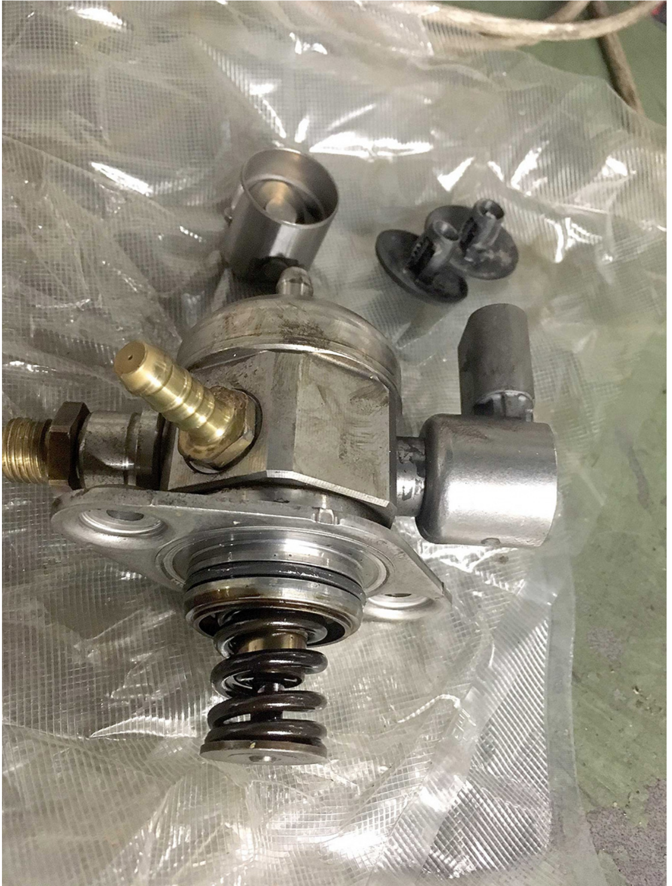
Фото.2. Паливний насос високого тиску на двигунах 1.8/2.0 TFSI

Але починати пошук несправностей рекомендується з перевірки герметичності паливопроводів, прохідності паливного фільтра і роботи електромагнітного клапана дозування