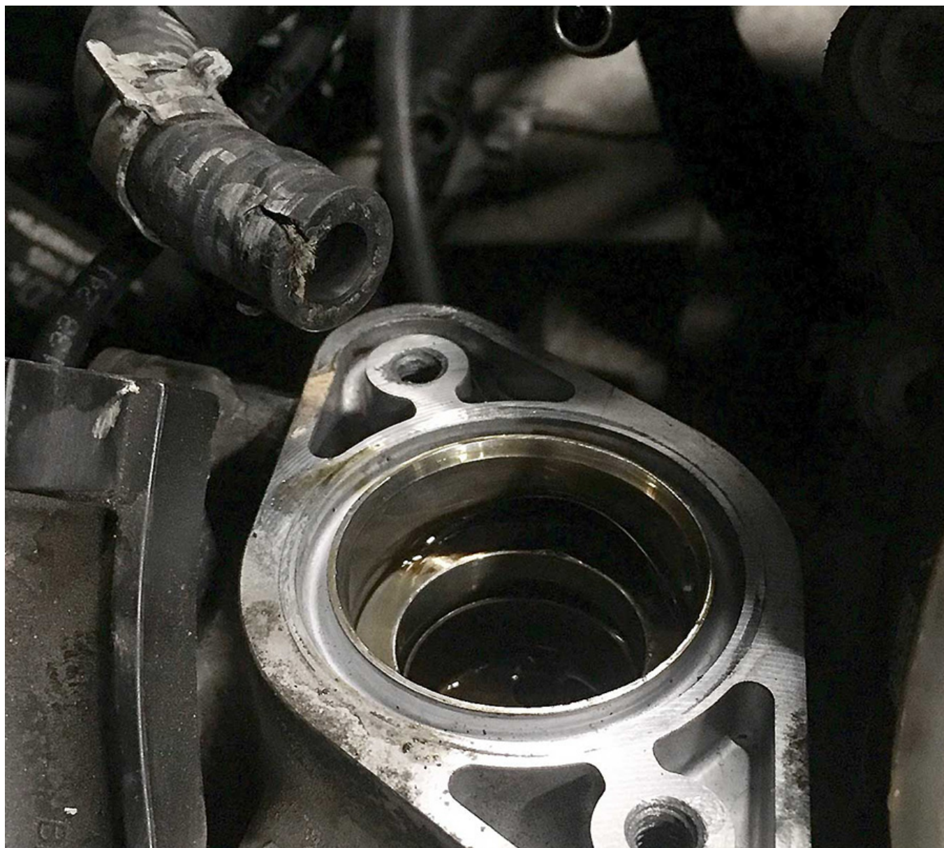
Фото.3. Тріщина в трубопроводі насоса високого тиску в двигуні 1.8 TFSI. На фото показано місце розташування насоса, який приводиться в дію кулачком розподільного валу випускних клапанів.

палива N290. Правильна напруга живлення електромагнітного клапана N290 (вимірювання слід проводити при увімкненому запалюванні) становить 12,2-14,5 вольт, виміряна в точці між контактом 1 (червоний/білий) і «масою» автомобіля.